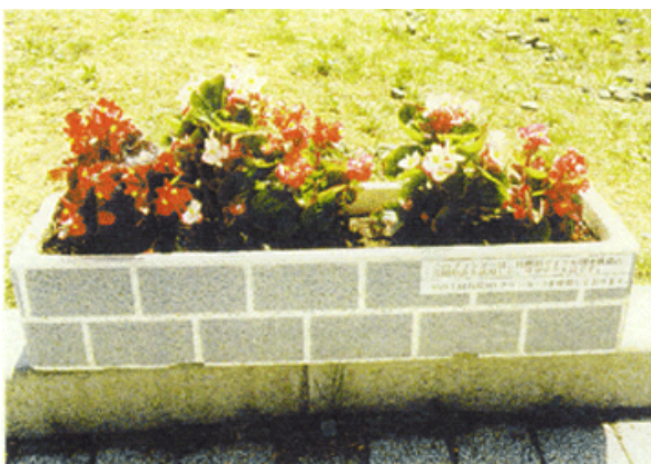
トロ箱をリサイクルした プランター

環境問題が大きく叫ばれている中で、市場では毎日大量の発泡スチロール容器の処理方法に苦慮しています。これに着目し、「発泡スチロール容器の有効活用に係わる実用化共同研究開発」を行い、魚用箱などに大量に使用されている発泡スチロール容器をリサイクル利用するため、洗浄・脱臭を十分に行った後、用途に合わせて塗装・加工を施し、さらにこれらに適度の強度を持たせて、本箱、オーディオラック、プランター等の商品を製造できるようにしました。